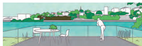
Secteur des Isles et Pirmil, Rezé et Nantes. La métropole verte habitée autour de la Loire et de la Sèvre. F. Bonnet.