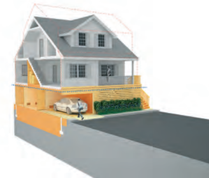
Réaménagement du bâti pour résister au risque d'inondation, agence d'urbanisme de New York.