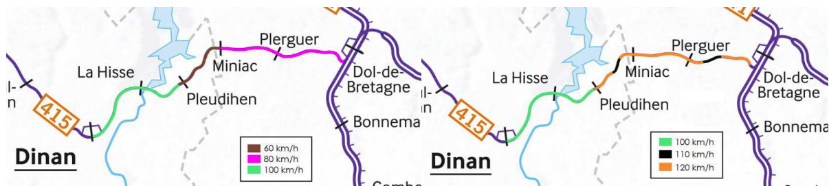
Figure 2 : Vitesses avant (à gauche) et après (à droite) renouvellement de la section Pleudihen-sur-Rance - Dol-de-Bretagne

Des travaux de renouvellement de voie ont déjà été menés en 2013 sur le reste du tronçon, soit entre Pleudihen-sur-Rance et Dinan, le dossier indiquant que ces travaux étaient nécessaires pour pérenniser la ligne. La vitesse y a été maintenue à 100 km/h.